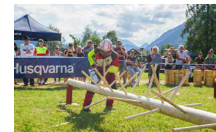
Spannung beim finalen Entasten © Kärntner Holzstraße

Jeder Teilnehmer hat also wieder ein anspruchsvolles Programm zu absolvieren.